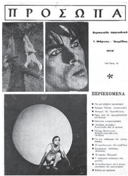
Το τεύχος του περιοδικού «Πρόσωπα» (1972)

Γ.Κ.: Το Πανεπιστήμιο όμως δεν είναι μόνο μέσα. Είναι και έξω... Α.Κ.: Τώρα θα 'ρθουμε σε αυτό... Είχα λοιπόν άφθονο χρόνο, με την έννοια ότι δεν πήγαινα στη Νομική. Και είχα μια καταλυτική επιρροή από το Μάη του '68 που πέφτει και αυτός επάνω σε αυτήν τη χρονική στιγμή. Τον Μάη τον καταλάβαινα με την έννοια της αμφισβήτησης κάθε εξουσίας, κάθε κατεστημένου, είτε αυτό λέγεται ευρύτερο πολιτικό σύστημα είτε αυτό λέγεται απλές καθημερινές σχέσεις ανδρών-γυναικών, διδασκόντων-διδασκομένων και ούτω καθεξής. Βαθύτατα λοιπόν επηρεασμένος από αυτά, αρχίζω να αναζητώ στον άπλετο ελεύθερο χρόνο που είχα άλλα ερεθίσματα. Και αρχίζω