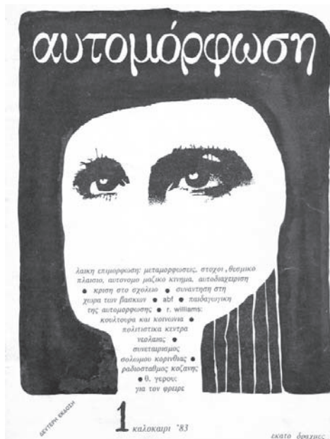
Το πρώτο τεύχος του περιοδικού «Αυτομόρφωση» (1983)

Α.Κ.: Γιατί είχε άρchiσε ένας μαρασμός, μια φθίνουσα δυστυ-